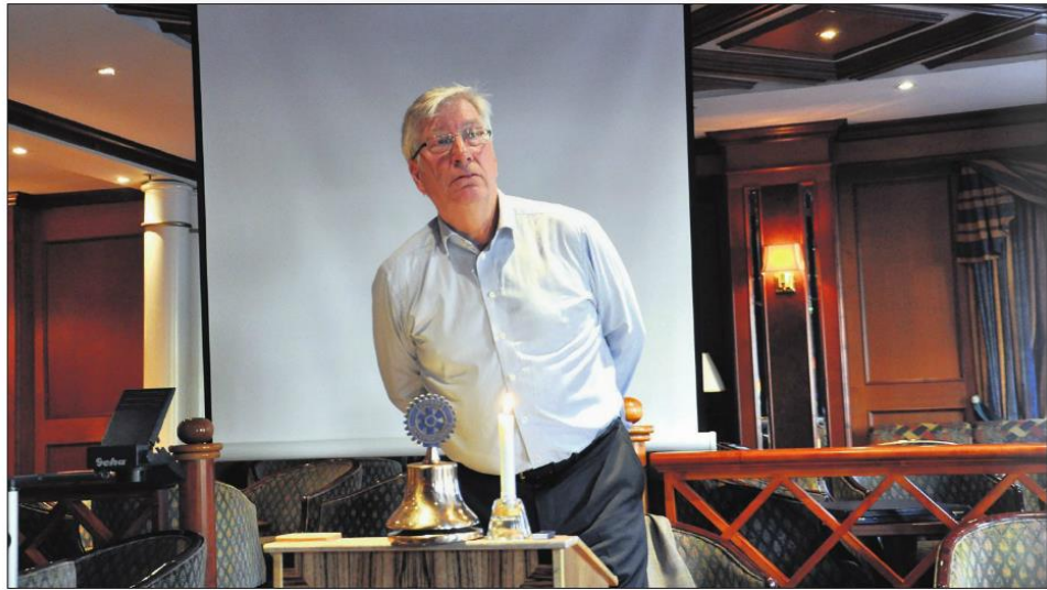
LUNT FOREDRAG: Med humor og en god porsjon lunhet holdt Sigbjørn Johnsen medlemmene i Mesna Rotary/Lillehammer Rotary i ånde i den halvtimen han hadde til rådighet på deres intercity-møte.

Men hedersgjesten hos Mesna Rotary/Lillehammer Rotary denne kvelden ville heller ikke være med på den betegnelsen. Riktignok er han født på Lillehammer og levde sine første måneder i Auggedalen, men mente likevel at han var hedmarking så god som noen. Sigbjørn Johnsen er lun og godslig, profesjonell og pratesjuk. Likevel klarte han (nesten) å holde seg innenfor den halvtimen han fikk til rådighet, uten at han slapp noen